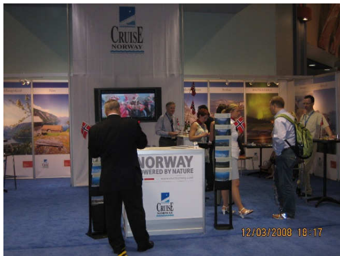
Cruise Norway stand i Miami

Cruise Norway stand i 2008 hadde for første gang felles profil og vi benyttet også Innovasjon Norge sin nye profil med www.visitnorway.com og slagordet "Powered by Nature". Vi fikk svært gode tilbakemeldinger på vår stand fra